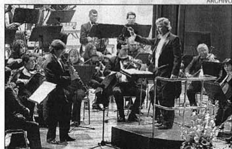
Sinfónica. La orquesta abrirá mañana su temporada 2008.

La Orquesta Sinfónica de la Ciudad de Asunción (OSCA) brindará mañana su primer concierto del año en el Parque Carlos Antonio López de Sajonia. Sus músicos, bajo la batuta del maestro Luis Szarán, actuarán desde las 18. La entrada será libre y gratuita.